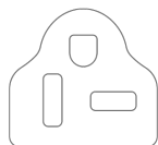
Câble secteur avec fiche (NEMA 6-20P)

LAUDA DR. R. WOBSEY GMBH & CO. KG Laudaplatz 1 • 97922 Lauda-Königshofen • DE