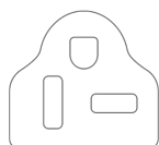
Netzkabel mit Stecker (NEMA 6-20P)

LAUDA DR. R. WOBSEY GMBH & CO. KG Laudaplatz 1 • 97922 Lauda-Königshofen • DE