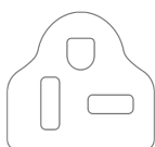
Netzkabel mit Stecker (NEMA 6-20P)

LAUDA DR. R. WOBSEY GMBH & CO. KG Laudaplatz 1 • 97922 Lauda-Königshofen • DE