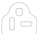
Câble secteur avec fiche (NEMA 6-20P)

LAUDA DR. R. WOBSEY GMBH & CO. KG Laudaplatz 1 • 97922 Lauda-Königshofen • DE