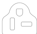
Câble secteur avec fiche (NEMA 6-20P)

LAUDA DR. R. WOBSEY GMBH & CO. KG Laudaplatz 1 • 97922 Lauda-Königshofen • DE