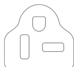
Câble secteur avec fiche (NEMA 6-20P)

LAUDA DR. R. WOBSEY GMBH & CO. KG Laudaplatz 1 • 97922 Lauda-Königshofen • DE