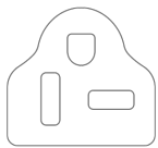
Netzkabel mit Stecker (NEMA 6-20P)