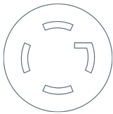
Câble secteur avec fiche (NEMA L16-30P twist lock; 30 A)