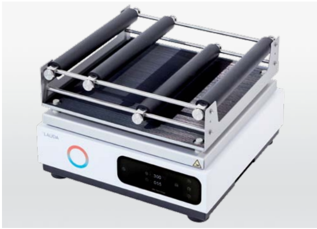
Les agitateurs robustes d'entrée de gamme à commande numérique – Varioshake VS 8 O et VS 8 B

Les agitateurs LAUDA Varioshake se distinguent par une très haute qualité, une grande longévité et une fiabilité absolue. Leur stabilité mécanique et leur faible usure garantissent un fonctionnement particulièrement silencieux, continu et fiable. Qu'il s'agisse de mélanger délicatement ou d'agiter vigoureusement, les agitateurs Varioshake et des accessoires sur mesure offrent toujours la solution idéale.