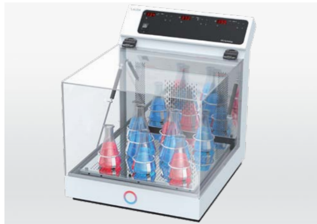
Varioshake VS 60 OI – compact, économique et performant

Qu'ils soient ordinaires et compacts ou bien robustes avec plusieurs niveaux d'agitation : les incubateurs agitateurs LAUDA Varioshake sont les experts du mélange et de l'agitation avec des mouvements circulaires parfaitement reproductibles et des températures maximales de 70 °C. Ils séduisent par une répartition optimale de la température dans l'ensemble de l'espace utile et de nombreuses fonctionnalités variées.