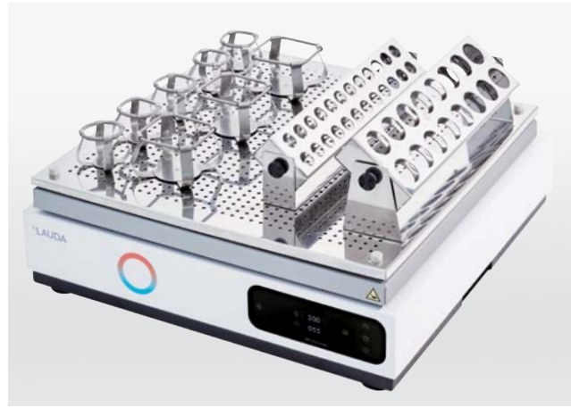
Une commande numérique moderne et des fonctionnalités étendues – Varioshake VS 15 O et VS 15 B