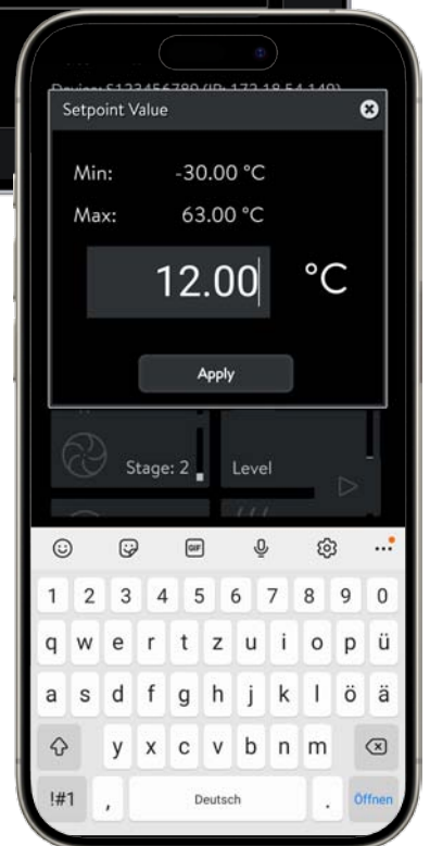
Aplicación LAUDA Command

* Se necesita Ethernet Modul Advanced (LRZ 930)