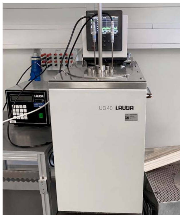
Рисунок 5: Экспериментальная установка в компании JUMO