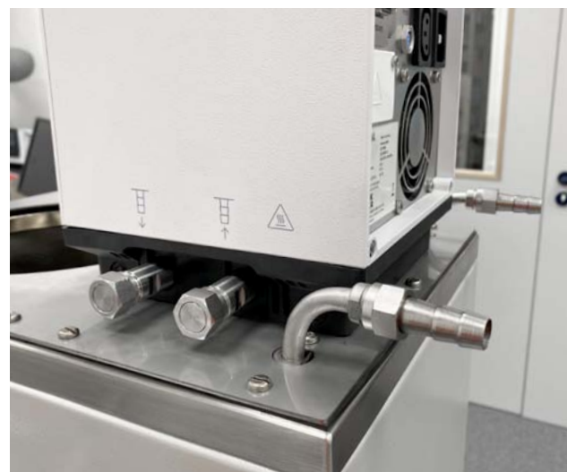
Figure 3 : Universa MAX relié à la partie inférieure UB 40 J et aux raccords de serpentins de refroidissement séparés

Chez JUMO, des mesures comparatives approfondies ont été réalisées avec de l'huile de silicone à une profondeur d'immersion de 220 mm pendant deux heures. On a obtenu un écart de température de 0,003 K et une homogénéité radiale de 0,0034 K. Ces deux valeurs représentent une nette amélioration par rapport au thermostat d'origine.