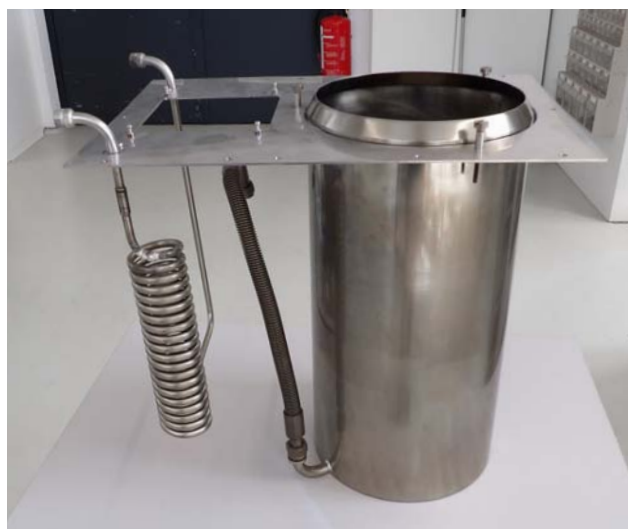
Figure 1 : Cylindre de la partie inférieure du bain avec un nouveau pont de bain et un serpentin de refroidissement installé

Sur le modèle UB 40 J, l'unité de commande est logée dans un boîtier séparé, distinct du bain thermostatique. La partie chauffante se compose d'une cuve soudée d'une profondeur de 450 mm, d'un serpentin de refroidissement et d'un insert de calibrage cylindrique. Le pont de bain est vissé à la cuve et supporte à la fois le serpentin de refroidissement et l'insert cylindrique. C'est en s'inspirant de la nouvelle gamme modulaire de thermostats à circulation de bain Universa qu'est née l'idée de conserver la construction mécanique de