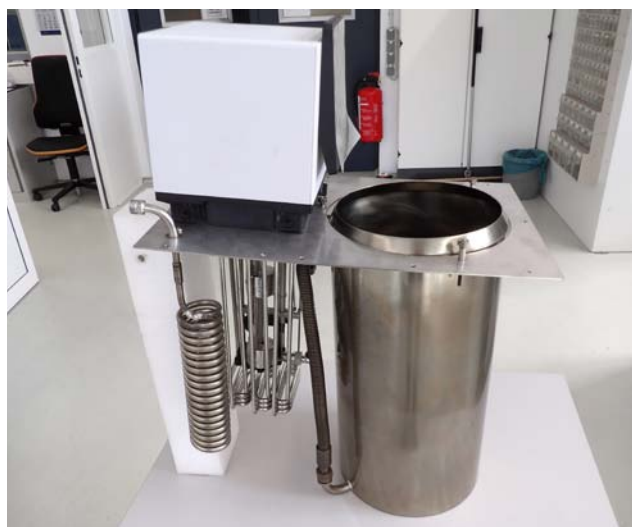
Figure 2 : Pont de bain avec unité de régulation de pompe Universa MAX installée