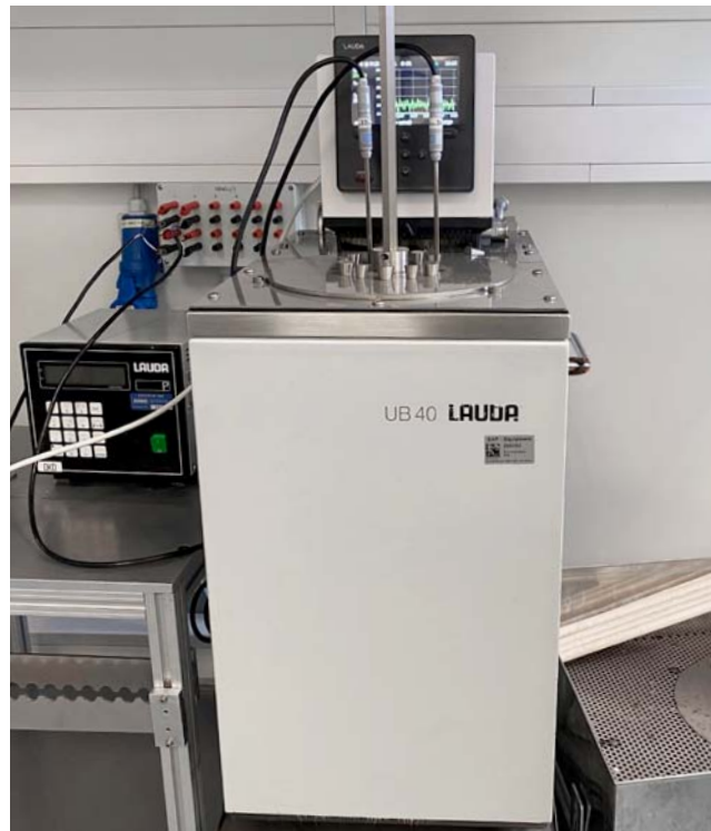
图 5 : JUMO现场验证装置