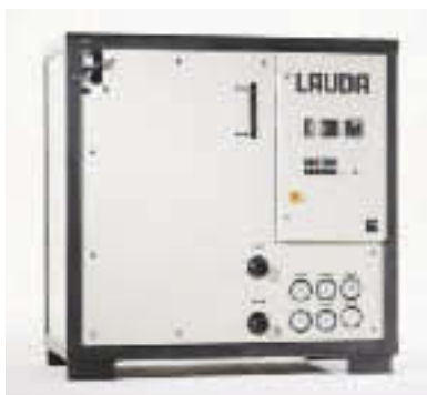
Abb. 1 Anschlussfertiges Plug & Play-Modul

Für das API-Technikum bei Altana war ein Temperaturfenster von -20 bis +160 °C erforderlich. „Kein Problem für unsere Anlage“, versichert Frank Kufen, „sie ist für den Bereich von -60 bis +200 °C konzipiert.“ Als optimaler Wärmeträger im Monofluidsystem wird ein Thermalöl genutzt, was sowohl die Möglichkeit zum Heizen als auch zum Tiefkühlen bietet. Die Steuerung läuft zentral über ein Prozessleitsystem, wobei die Temperieranlagen bei Bedarf auch über die Schaltschränke an den Anlagen bedient werden können. Hinzu kommen die Visualisierung und die komplette Prozessdatenerfassung. Die Anpassung der Temperieranlage an das Prozessleitsystem und die Abstimmung der Schnittstellen erfolgte in enger Zusammenarbeit mit Lauda.